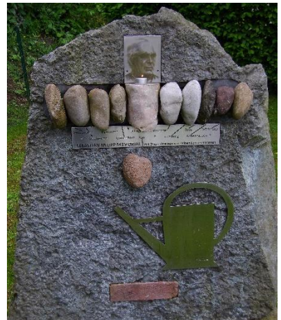
„Kneipp Memorial“ – von Peter Knoll