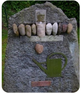
„Kneipp Memorial“ – von Peter Knoll